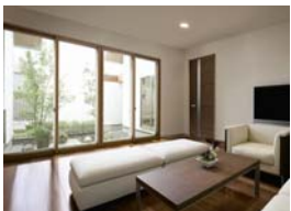
施工例/キャラメルウッドG使用

今ある窓にプラスするだけ。 お部屋のイメージはそのままに簡単に取り付けできます。