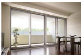
施工例/ライトグレーG使用