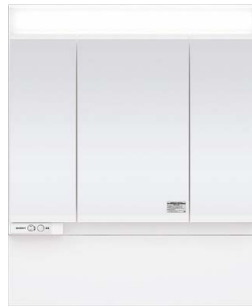
スタンダードLED3面鏡 ミドルパネル